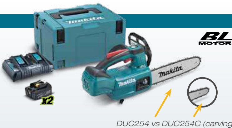
DUC254 vs DUC254C (carving)