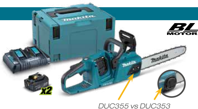
DUC355 vs DUC353